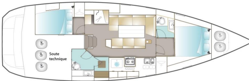
VERSION / DEUX CABINES DONT CABINE PROPRIÉTAIRE AVANT + SALLE DE BAINS (OPTION)