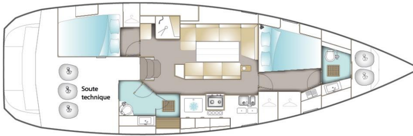
VERSION / DEUX CABINES