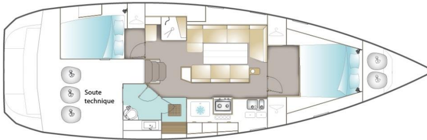
VERSION / DEUX CABINES DONT CABINE PROPRIÉTAIRE AVANT