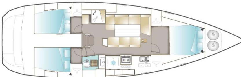
VERSION / FAMILLE AVEC CABINE PROPRIÉTAIRE AVANT (OPTION)