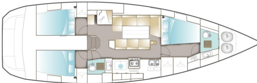
VERSION / FAMILLE / TROIS CABINES (OPTION)